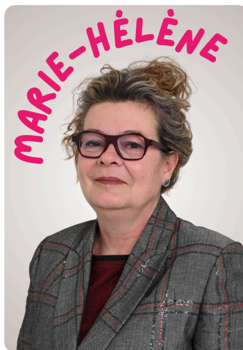
Atelier Coup de Pouce "Au Féminin" 🚺