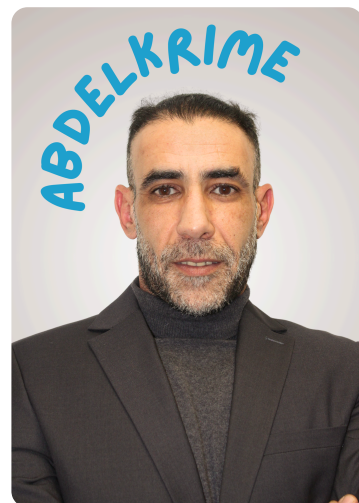
Atelier Coup de Pouce "Parcours Renforcé" 💪