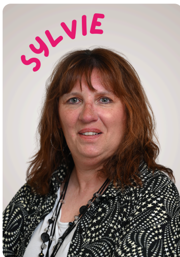
Atelier Coup de Pouce "Au Féminin" 🚺