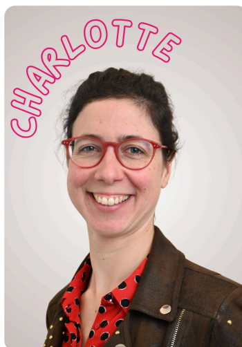
Atelier Coup de Pouce "Parcours Renforcé" 💪