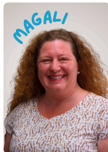
Atelier Coup de Pouce