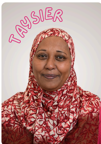
Atelier Coup de Pouce "Parcours Renforcé" 💪