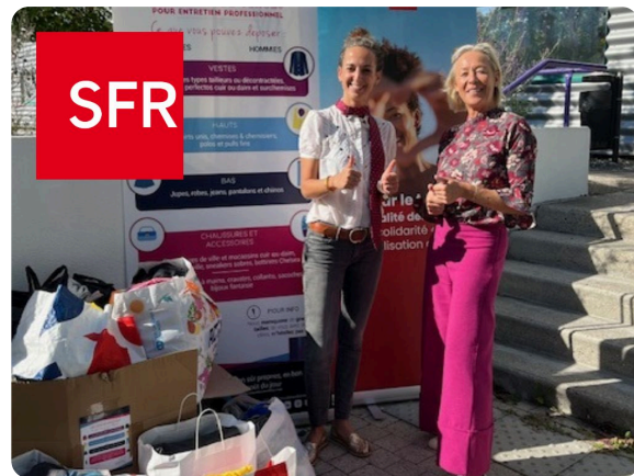
Collecte du 29 septembre au 14 octobre pour SFR