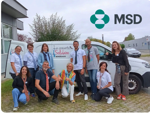
Journée de Solidarité le 9 octobre pour MSD France