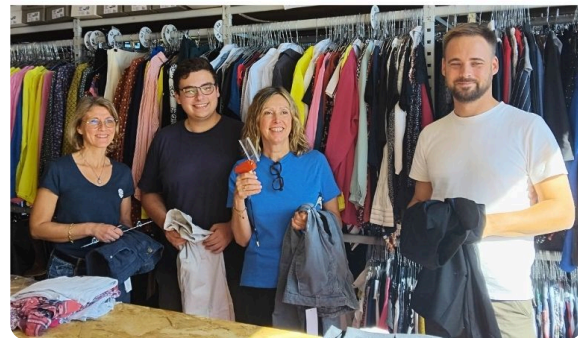
Collecte du 6 au 24 octobre, et session de tri le 16 pour KPMG